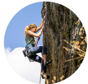
Bergsport & Freizeit